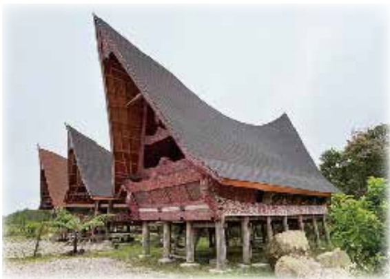
インドネシア・スマトラにて